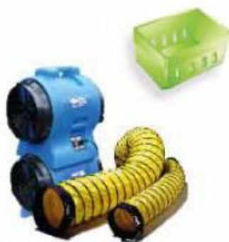
Vendita Macchinari Attrezzature Prodotti e Accessori