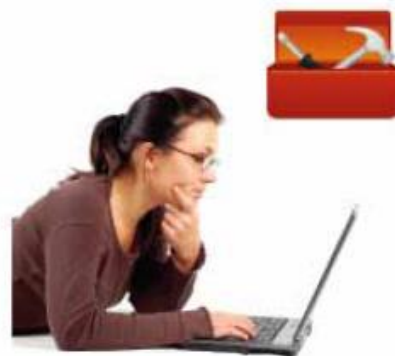
Noleggio Macchinari e Attrezzature

Disponibile sul nostro sito web anche il CATALOGO STAMPI, con tante immagini che descrivono le varie soluzioni grafiche di realizzazione PAVIMENTI STAMPATI, con relativo codice per richiedere più facilmente informazioni commerciali. Clicca qui per scaricare il CATALOGO.